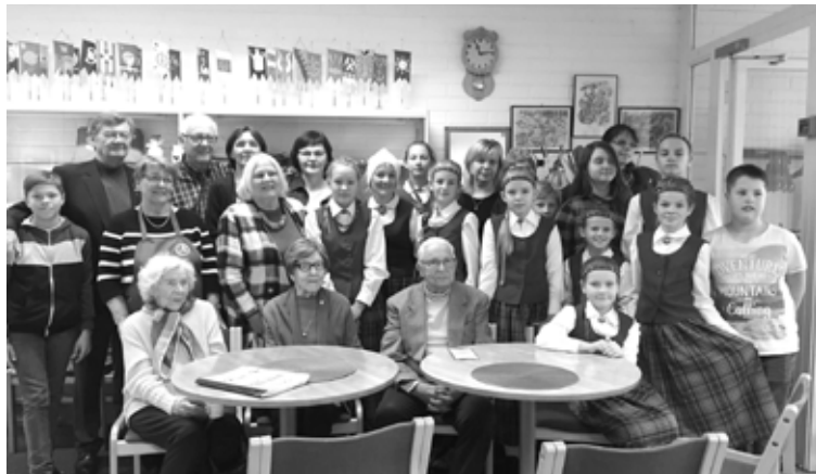
Bejas pamatskolas skolēni, viesojoties Somijā

Koncertprogramma ir vēstījums par mūsu tautu, valsti un ir sveiciens Latvijas un Somijas valstu svētkos pateicībā somu tautas devumam Latvijas Neatkarības izcīnīšanā. Programmu ievada abu valstu himnas, to papildina somu tautas dziesmas, rotaļdejas, digitālā ekspozīcija "Latvijas Brīvības cīņas Alūksnes pusē" un radošās darbnīcas, kurās piedāvājam iemācīties veidot latvisko telpu dekoru (ķīstu), gatavot dažādus latviešu tradicionālos ēdienus. 2017. gada 6. decembrī Somija svinēs savas valsts simtgadi. Valsts