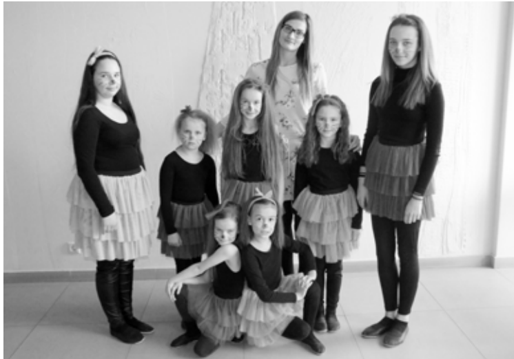
Bērnu mūsdienu deju kolektīvs Kolberģa tautas namā darbu sāka 2016. gada oktobrī

Paredzēta pirmā tikšanās ar senioriem, lai dalītos savās vēlmēs un