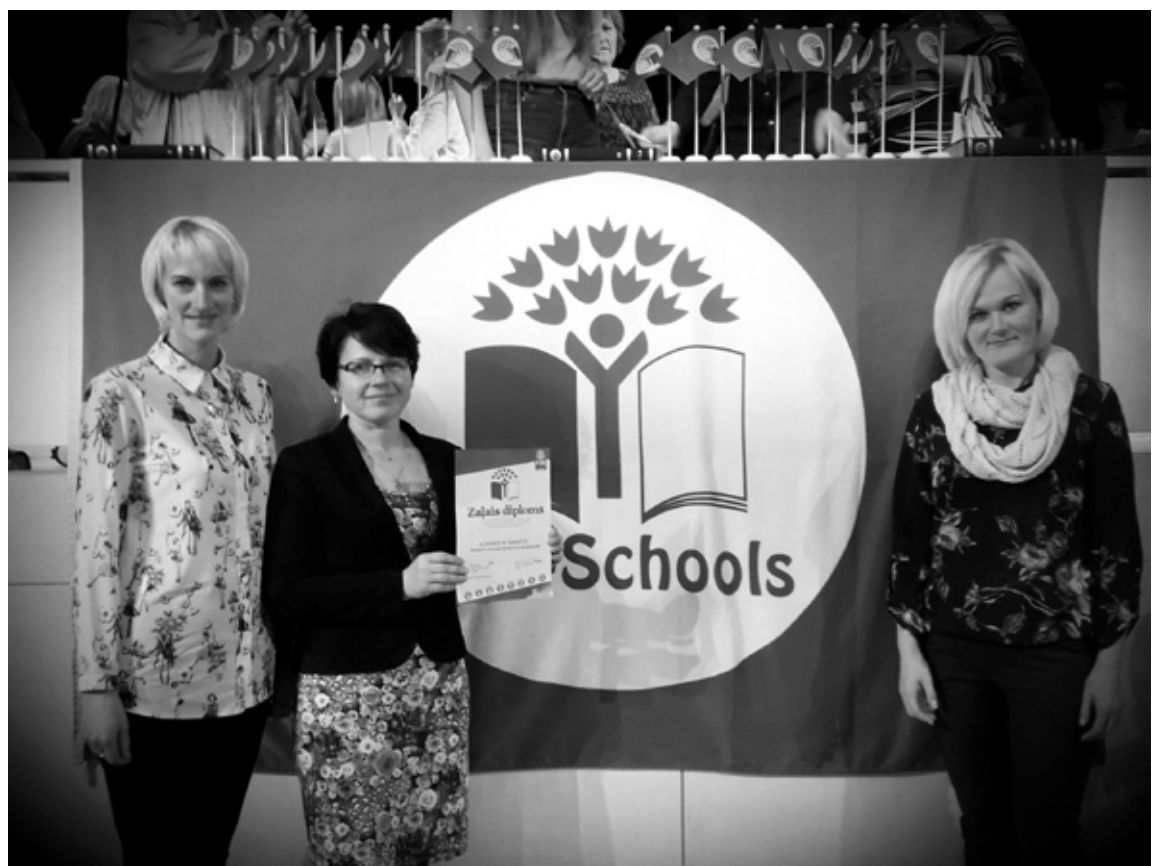
Pirmsskolas izglītības iestāde "Sprīdītis" šo mācību gadu sācis kā Ekoskola

Apliecinot gatavību turpināt darbu kompetenču izglītības modelī, 4. un 5. grupu skolotājas veidoja savstarpējo sadarbību, piedaloties Pasaules lielākajā mācību stundā ar nodarbību "Katram šķīvim savs stāsts". Šis nodarbības iesākums meklējams jau maijā, kad bērni paši stādīja kartupeļus, pētīja to augšanu, septembrī novāca ražu un gatavoja kartupeļu pankūkas. Septiņu grupu skolotājas jau pavasarī vienojās par kopīgu sadarbību dabas takas nodarbību organizēšanā izglītības iestādes laukumos. 12. oktobrī bijām viena no tūkstošiem izglītības iestāžu visā pasaulē, kas piedalījās Āra izglītības dienā, organizējot nodarbību bērniem iestādes dabas takā pie ozola. Pasaules pārtikas dienā, 16. ok-