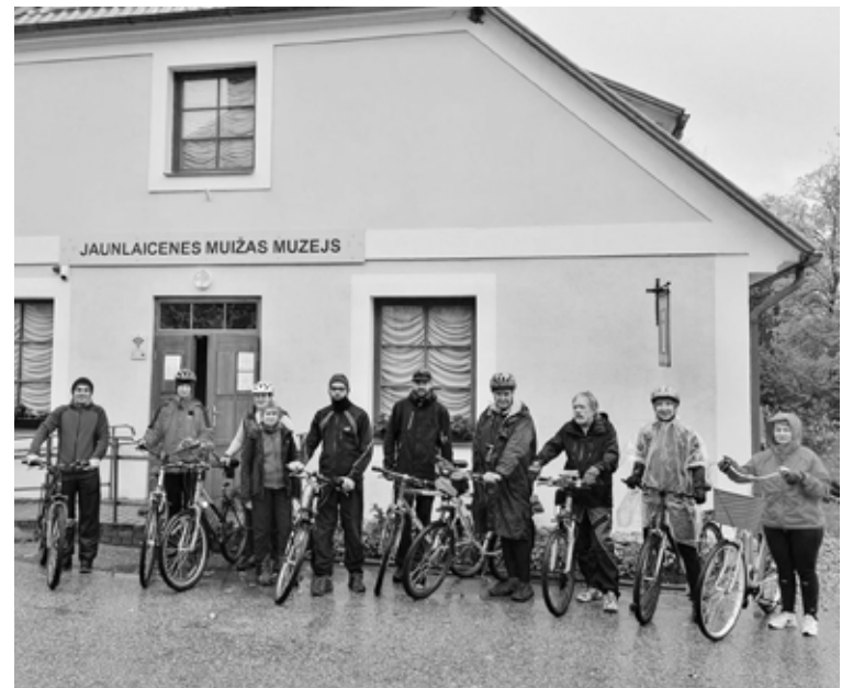
Velobrauciena dalībnieki, viesojoties Jaunlaicenes muižas muzejā

Nākamais apceļošanas pasākums plānots ziemā un, esot pietiekoši biežai sniega segai, tā būs slēpošana.